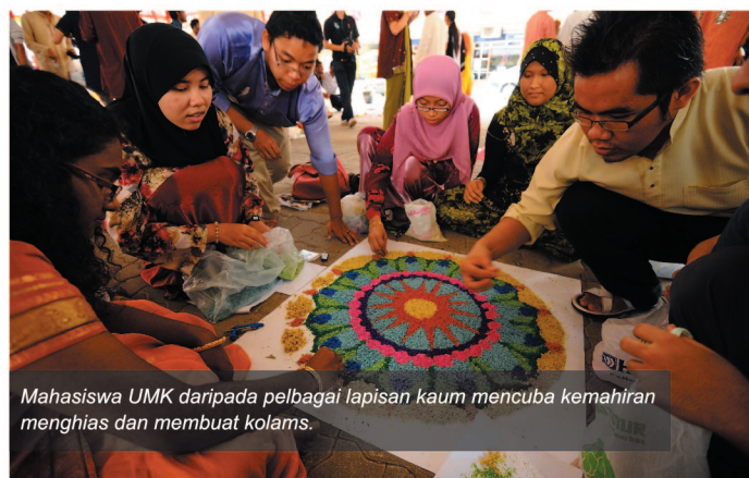
Mahasiswa UMK daripada pelbagai lapisan kaum mencuba kemahiran menghias dan membuat kolams.