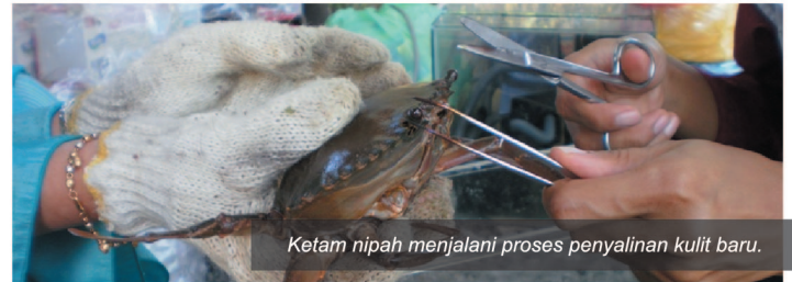
Ketam nipah menjalani proses penyalinan kulit baru.

"Proses semula jadi ketam nipah akan bersalin kulit sebelum mengawan atau bertelur dan kebiasaannya ketam betina mampu mengeluarkan telur sebanyak tiga kali untuk setiap kali proses mengawan.