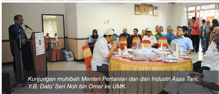
Kunjungan muhibah Menteri Pertanian dan dan Industri Asas Tani, Y.B. Dato' Seri Noh bin Omar ke UMK.

PELAKSANAAN Program Gerak Siswazah Tani antara mekanisme terbaik Kementerian Pertanian dan Industri Asas Tani (MOA) untuk membudayakan bidang keusahawanan tani di kalangan belia terutamanya yang membabitkan golongan siswazah.