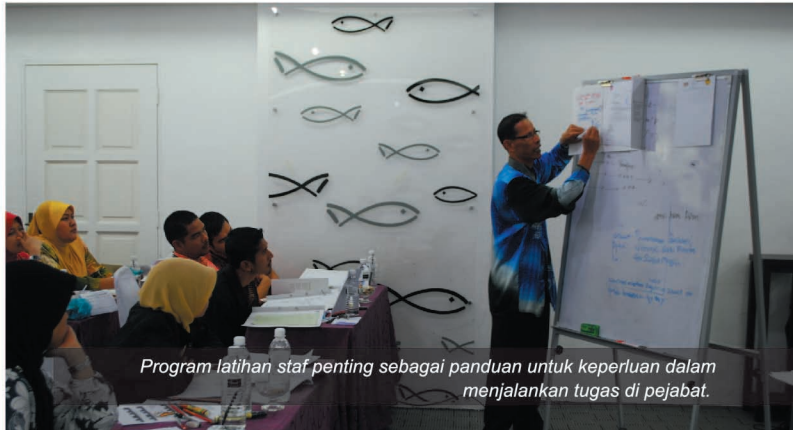
Program latihan staf penting sebagai panduan untuk keperluan dalam menjalankan tugas di pejabat.

Pada masa sama, BPMI juga menganjurkan Bengkel Penyediaan Soalan Peperiksaan (23 hingga 24 Februari 2011), Kursus Pengurusan Fail, Rekod, dan Surat Rasmi (2 hingga 3 Mac 2011) dan Kursus Komunikasi Berkesan (8 hingga 9 Mac 2011).