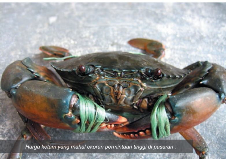
Harga ketam yang mahal ekoran permintaan tinggi di pasaran.

"Kami berharap hasil daripada projek ini akan dimanfaatkan kepada para peternak ketam nipah yang menghadapi masalah kekurangan benih ketam nipah," kata beliau.