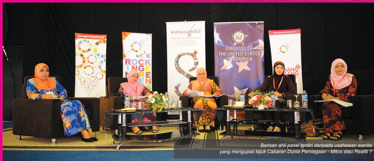
Barisan ahli panel terdiri daripada usahawan wanita yang mengupas tajuk Cabaran Dunia Perniagaan - Mitos atau Realiti ?