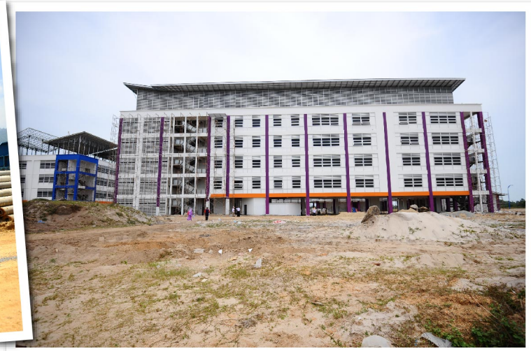
SESI LAWATAN KERJA NAIB CANSOLOR KE KAMPUS BACHOK DAN JELI