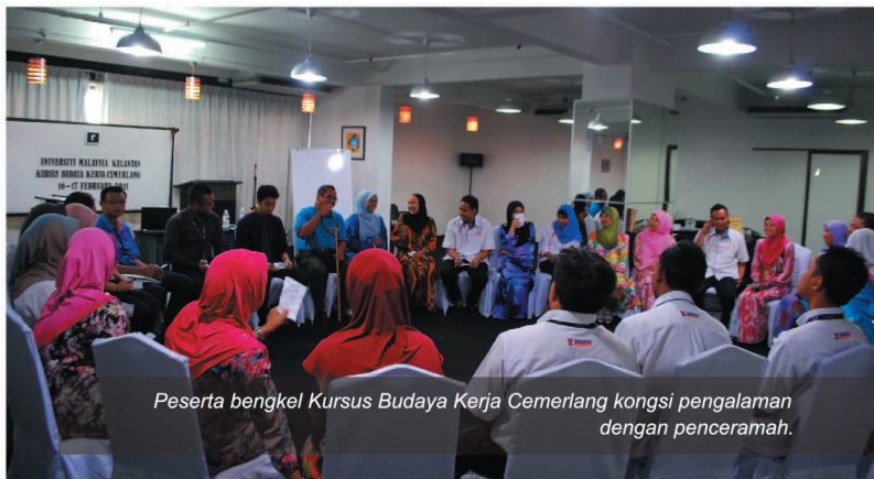
Peserta bengkel Kursus Budaya Kerja Cemerlang kongsi pengalaman dengan penceramah.