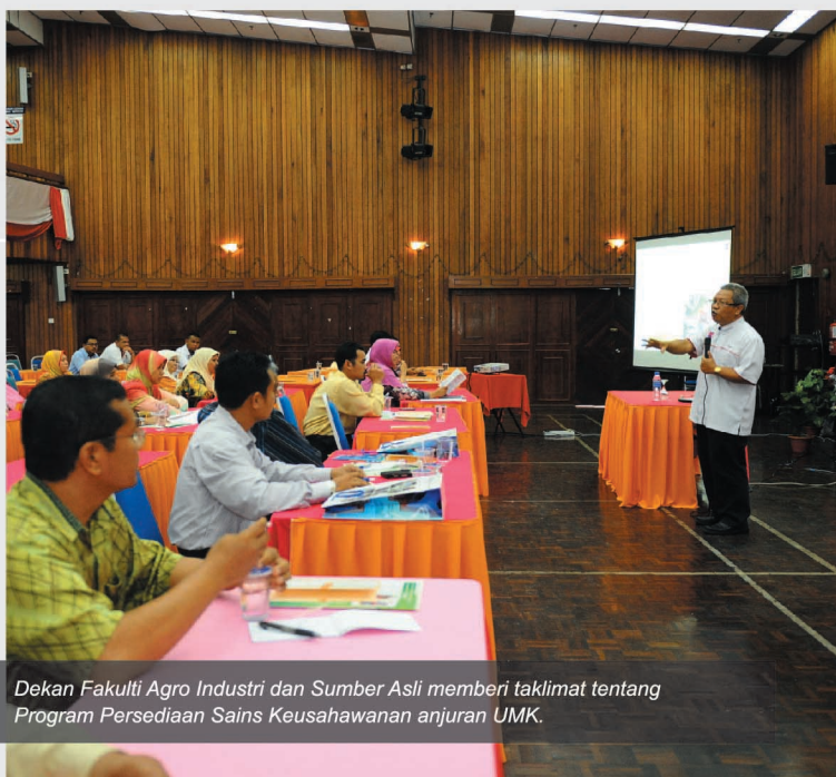
Dekan Fakulti Agro Industri dan Sumber Asli memberi taklimat tentang Program Persediaan Sains Keusahawanan anjuran UMK.

UNIVERSITI Malaysia Kelantan (UMK) melalui Pusat Komunikasi Korporat, Jabatan Canselori telah menganjurkan Hari Bertemu Pelanggan 2011 bertempat di Dewan Auditorium, Kompleks MARA Negeri Kelantan pada 19 Mac 2011.