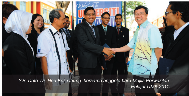
Y.B. Dato' Dr. Hou Kok Chung bersama anggota baru Majlis Perwakilan Pelajar UMK 2011.