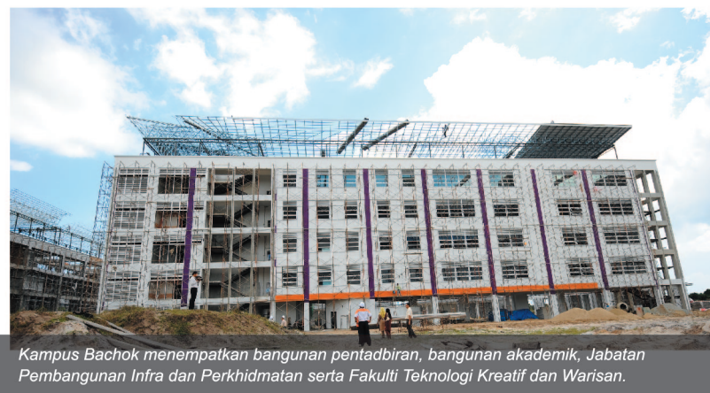
Kampus Bachok menempatkan bangunan pentadbiran, bangunan akademik, Jabatan Pembangunan Infra dan Perkhidmatan serta Fakulti Teknologi Kreatif dan Warisan.

"Kewujudan UMK telah membuka lembaran baru dalam dunia pendidikan di negeri Kelantan kerana UMK adalah satu-satunya Universiti penuh yang ditempatkan di negeri Kelantan dan Universiti pertama yang berteraskan keusahawanan di negara ini," jelasnya.