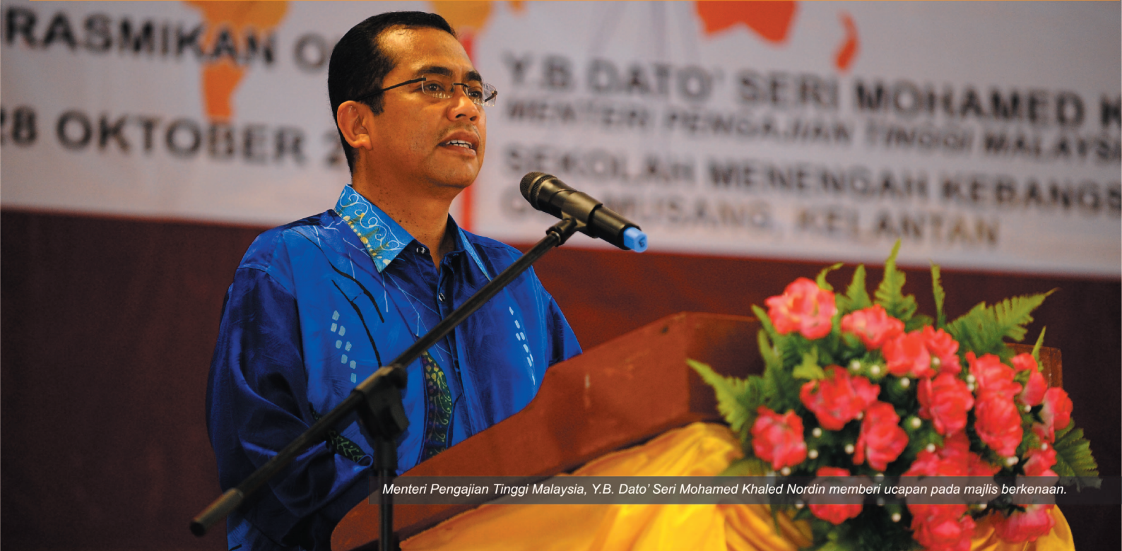
Menteri Pengajian Tinggi Malaysia, Y.B. Dato' Seri Mohamed Khaled Nordin memberi ucapan pada majlis berkenaan.

INSTITUSI pengajian tinggi (IPT) perlu memainkan peranan masing-masing dengan menjadikan pembasmian kemiskinan sebagai salah satu agenda utama Universiti dalam usaha membantu mengurangkan kadar kemiskinan negara ke tahap sifar menjelang 2020.