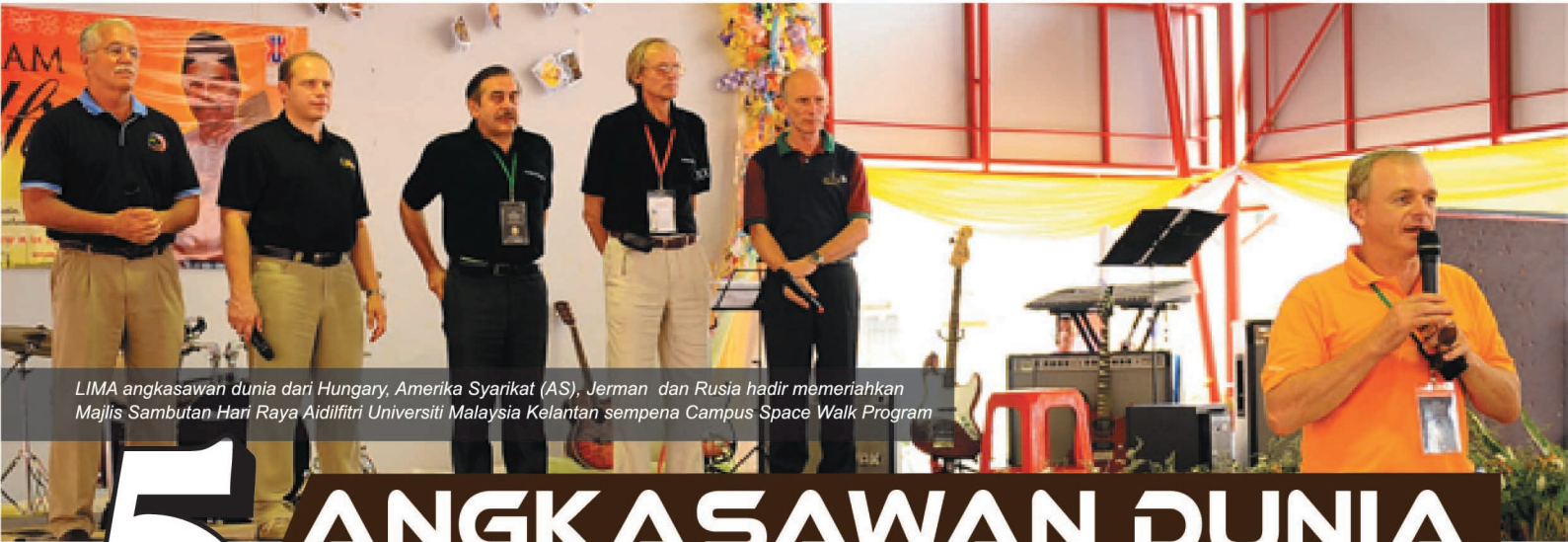
LIMA angkasawan dunia dari Hungary, Amerika Syarikat (AS), Jerman dan Rusia hadir memeriahkan Majlis Sambutan Hari Raya Aidilfitri Universiti Malaysia Kelantan sempena Campus Space Walk Program