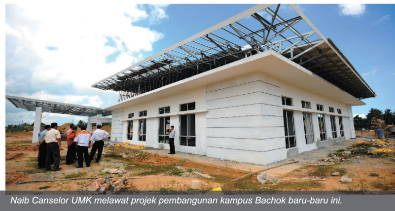
Naib Canselor UMK melawat projek pembangunan kampus Bachok baru-baru ini.