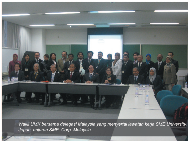
Wakil UMK bersama delegasi Malaysia yang menyertai lawatan kerja SME University, Jepun, anjuran SME Corp. Malaysia.

DALAM merangka aktiviti dan latihan pembangunan sumber manusia yang kompeten dan berpengetahuan, Universiti Malaysia Kelantan (UMK) telah mengambil beberapa langkah termasuk mengadakan lawatan kerja ke Tokyo SME University, Jepun pada 4 Oktober 2010.