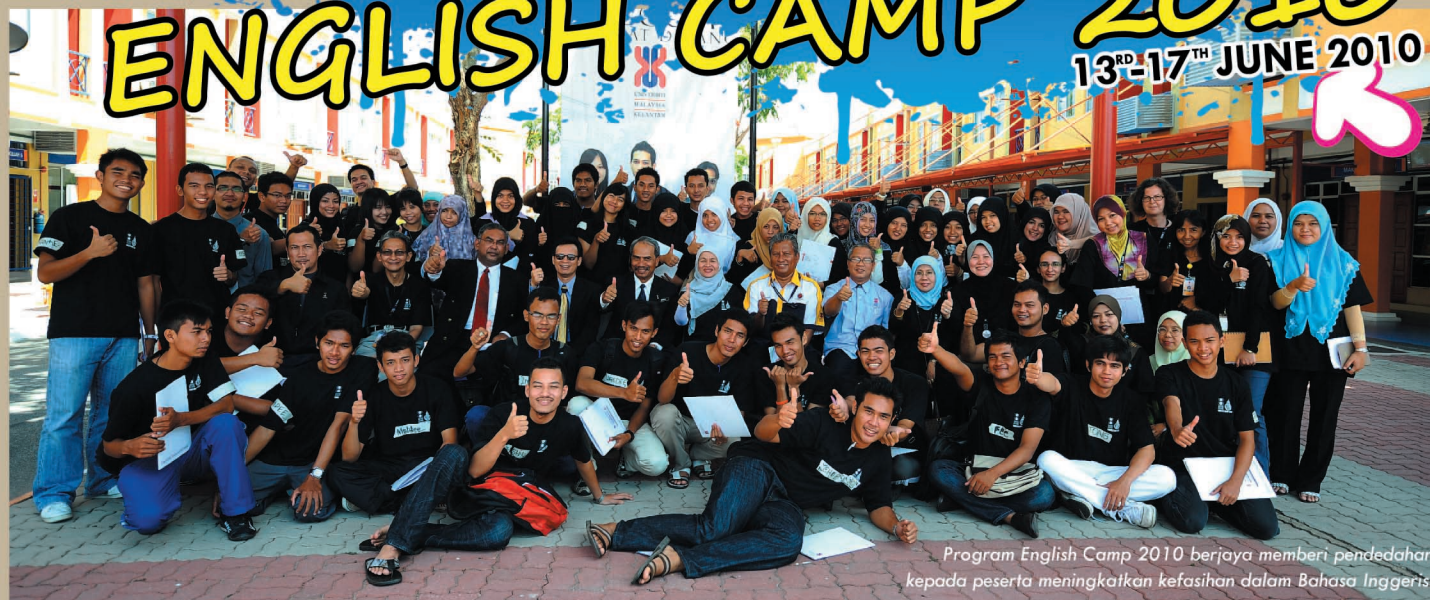
Program English Camp 2010 berjaya memberi pendedahan kepada peserta meningkatkan kefasihan dalam Bahasa Inggeris.

ENGLISH CAMP 2010 13 RD -17 TH JUNE 2010