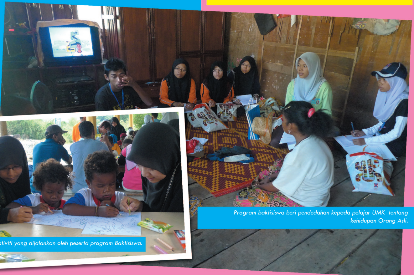
Sebahagian aktiviti yang dijalankan oleh peserta program Baktisiswa.

"Untuk tujuan itu, kesemua pelajar FPV UMK telah mengedarkan risalah-risalah dan poster di sekitar kawasan UMK mengenai Kempen Kesedaran Pengawalan Kucing Terbiar supaya mereka lebih memandang serius isu ini," katanya.