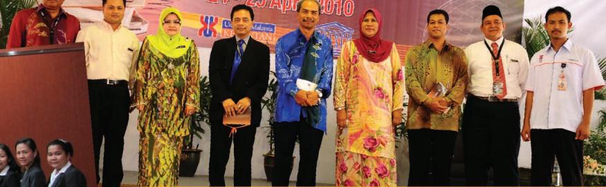
Majlis Perasmian World Book & Copyright Day UNESCO 2010, di Dewan Terbuka Keusahawanan, UMK, pada 24 - 25 April 2010.