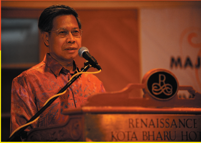
Ucapnaya oleh Menteri Perdagangan Antarabangsa dan Industri, Y.B. Dato' Sri Mustapa bin Mohamed