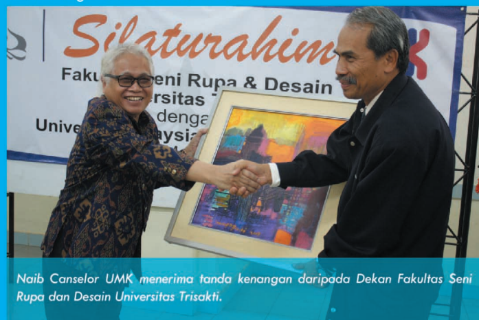
Naib Canselor UMK menerima tanda kenangan daripada Dekan Fakultas Seni Rupa dan Desain Universitas Trisakti.

Pada lawatan itu, delegasi UMK telah dibawa melawat ke pameran memperingati peristiwa berdarah reformasi Indonesia yang berlaku 12 tahun dahulu (tahun 1998) di mana Universitas Trisakti kehilangan empat orang pelajarnya yang telah mengetuai reformasi tersebut.