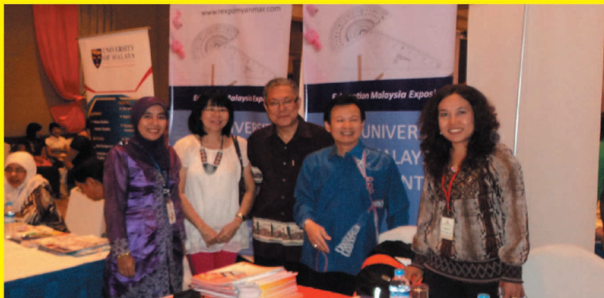
Pameran Education Malaysia Exposition beri peluang warga Myanmar belajar di UMK.