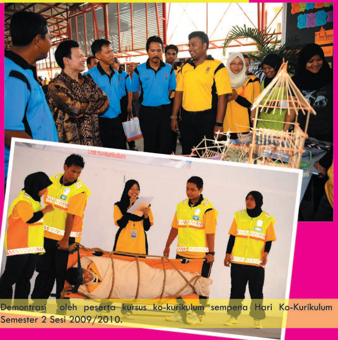
Demonstrasi oleh peserta kursus ko-kurikulum sempena Hari Ko-Kurikulum Semester 2 Sesi 2009/2010.

"Ia juga dapat mewujudkan hubungan kerjasama antara pelajar semasa merancang dan melaksanakan sesuatu aktiviti dengan lebih kreatif dan inovatif seiring dengan matlamat UMK untuk muncul sebagai sebuah universiti keusahawanan. Selain itu, program tersebut secara tidak langsung diharap dapat mewujudkan ciri-ciri kemahiran insaniah ( soft skills ) seperti yang dikehendaki oleh pihak industri pada masa sekarang," katanya.