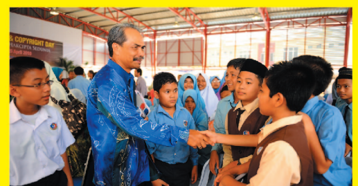
Pelajar sekolah mengambil peluang bermesra dengan Naib Canselor UMK.