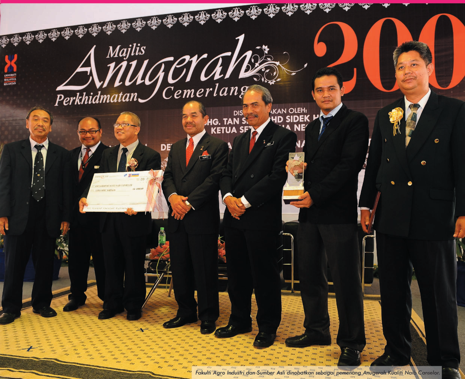
Fakulti Agro Industri dan Sumber Asli dinobatkan sebagai pemenang, Anugerah Kualiti Naib Canselor.

Sementara itu, seramai 41 kakitangan UMK menerima Anugerah Perkhidmatan Cemerlang 2009 dengan sembilan daripadanya merupakan penerima Anugerah Gemilang UMK (AGU) daripada pelbagai kategori antaranya AGU khas universiti, keusahawanan, pengajaran dan pembelajaran serta perkhidmatan.