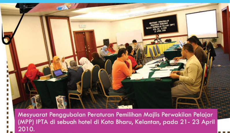
Mesyuarat Penggubalan Peraturan Pemilihan Majlis Perwakilan Pelajar (MPP) IPTA di sebuah hotel di Kota Bharu, Kelantan, pada 21 - 23 April 2010.