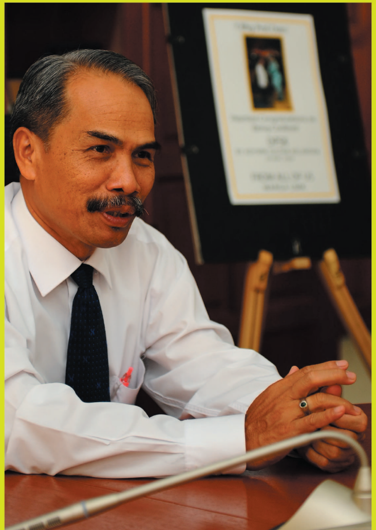
Individu yang mempunyai sifat-sifat keusahawanan lazimnya mereka yang kreatif, inovatif dan yang melakukan perubahan - Naib Canselor.

Sebagai contoh, kata beliau individu yang terlibat dalam bidang perubatan veterinar dapat mengamalkan nilai keusahawanan dengan memikirkan bagaimana cara penjagaan haiwan itu dapat dibuat dengan lebih baik dan sempurna, bukan hanya semata-mata memberi rawatan kepada haiwan apabila ianya mengalami masalah kesihatan.