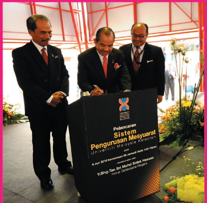
Y.Bhg. Tan Sri Mohd Sidek bin Hassan, Ketua Setiausaha Negara melancarkan Sistem Pengurusan Mesyuarat di Universiti Malaysia Kelantan sempena Majlis Anugerah Perkhidmatan Cemerlang 2009.